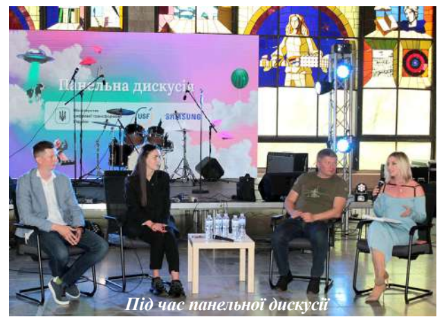
Під час панельної дискусії