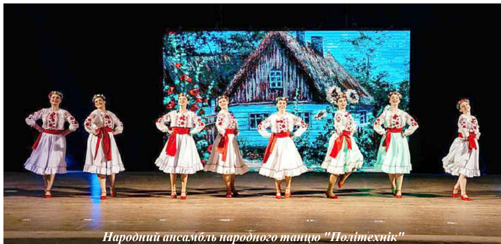
Народний ансамбль народного танцю "Політехнік"