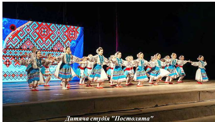
Дитяча студія "Постолята"