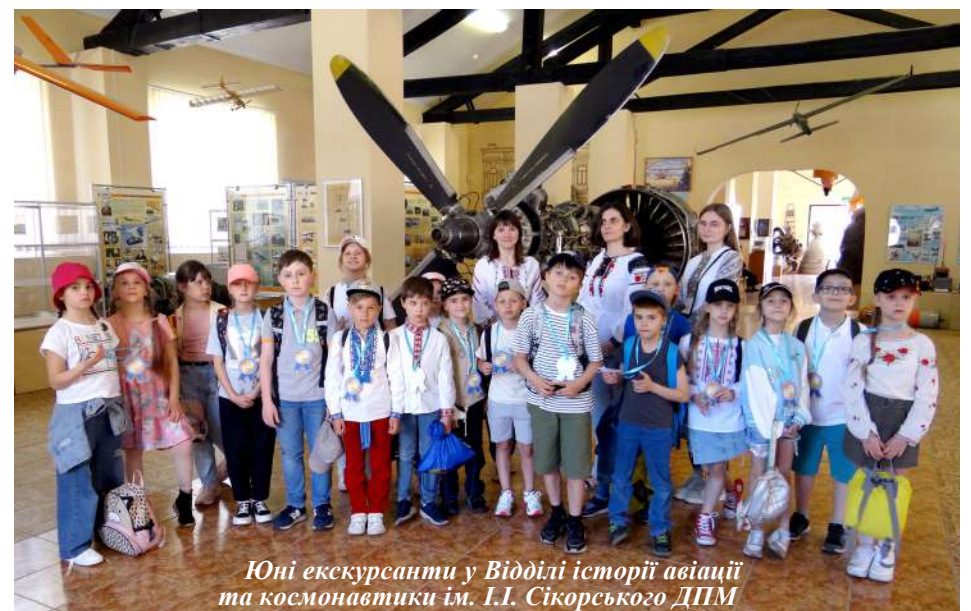
Юні екскурсанти у Відділі історії авіації та космонавтики ім. І.І. Сікорського ДПМ