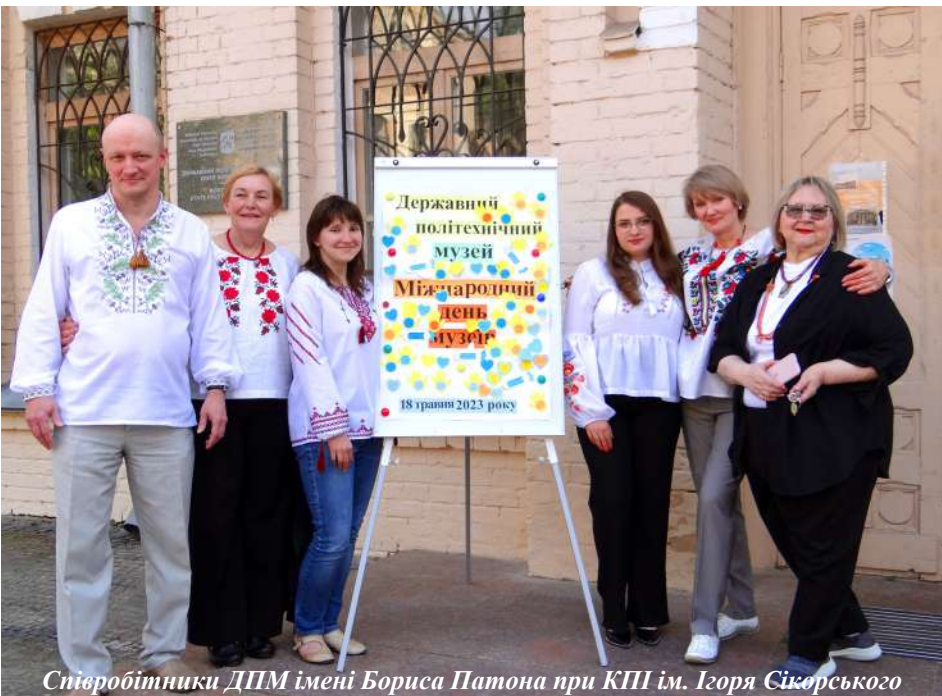
Співробітники ДПМ імені Бориса Патона при КПІ ім. Ігоря Сікорського

Щороку 18 травня Державний політехнічний музей імені Бориса Патона при КПІ ім. Ігоря Сікорського відзначає Міжнародний день музеїв. Свято це засновано ще 1977 року Міжнародною радою музеїв і тепер відіграє важливу роль у формуванні історичної пам'яті народу та його національної ідентичності.