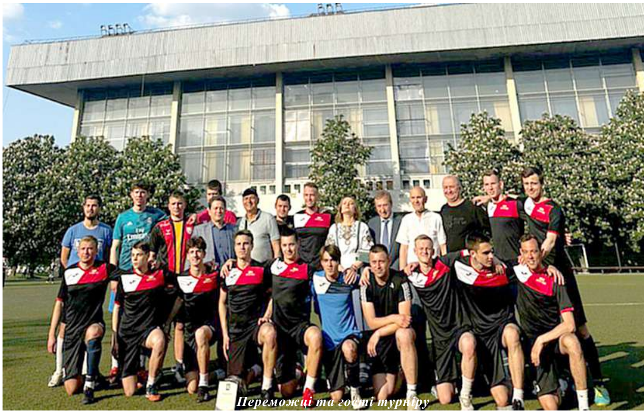
Переможці та гості турніру