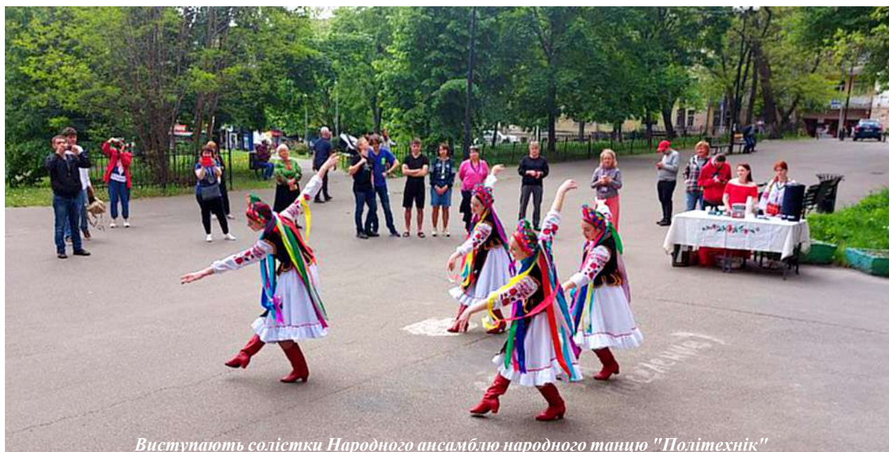
Виступають солістки Народного ансамблю народного танцю "Політехнік"

лився зі слухачами переживаннями, що линуть з власної душі.