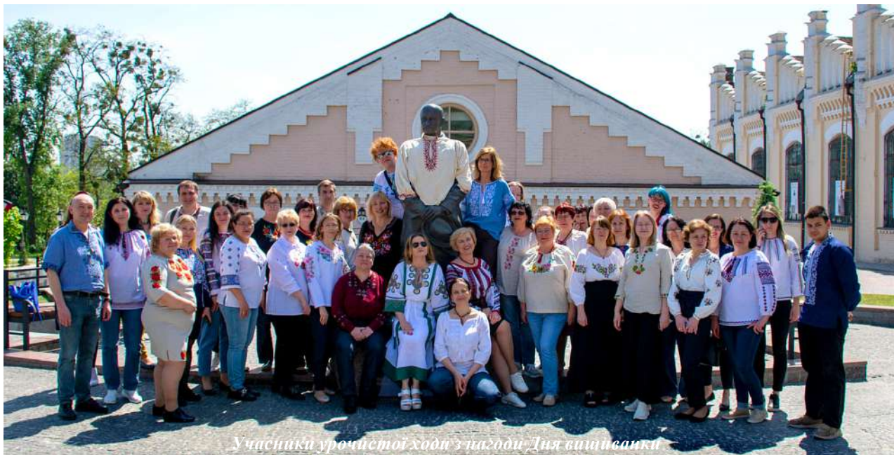
Учасники урочистої ходи з нагоди Дня вишиванки