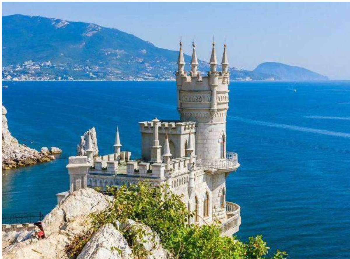
Ласточкино гнездо в Крыму