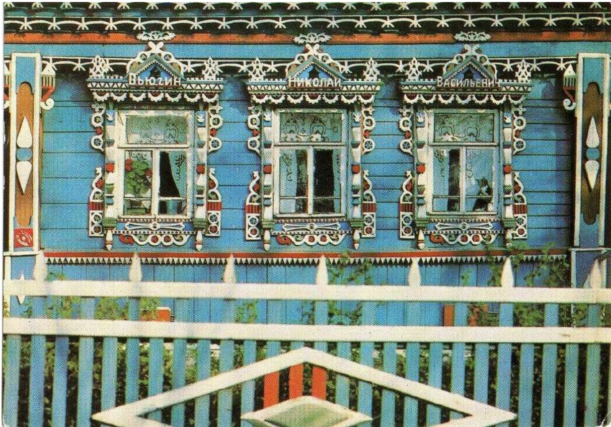
Дом в сибирском стиле в Иркутске