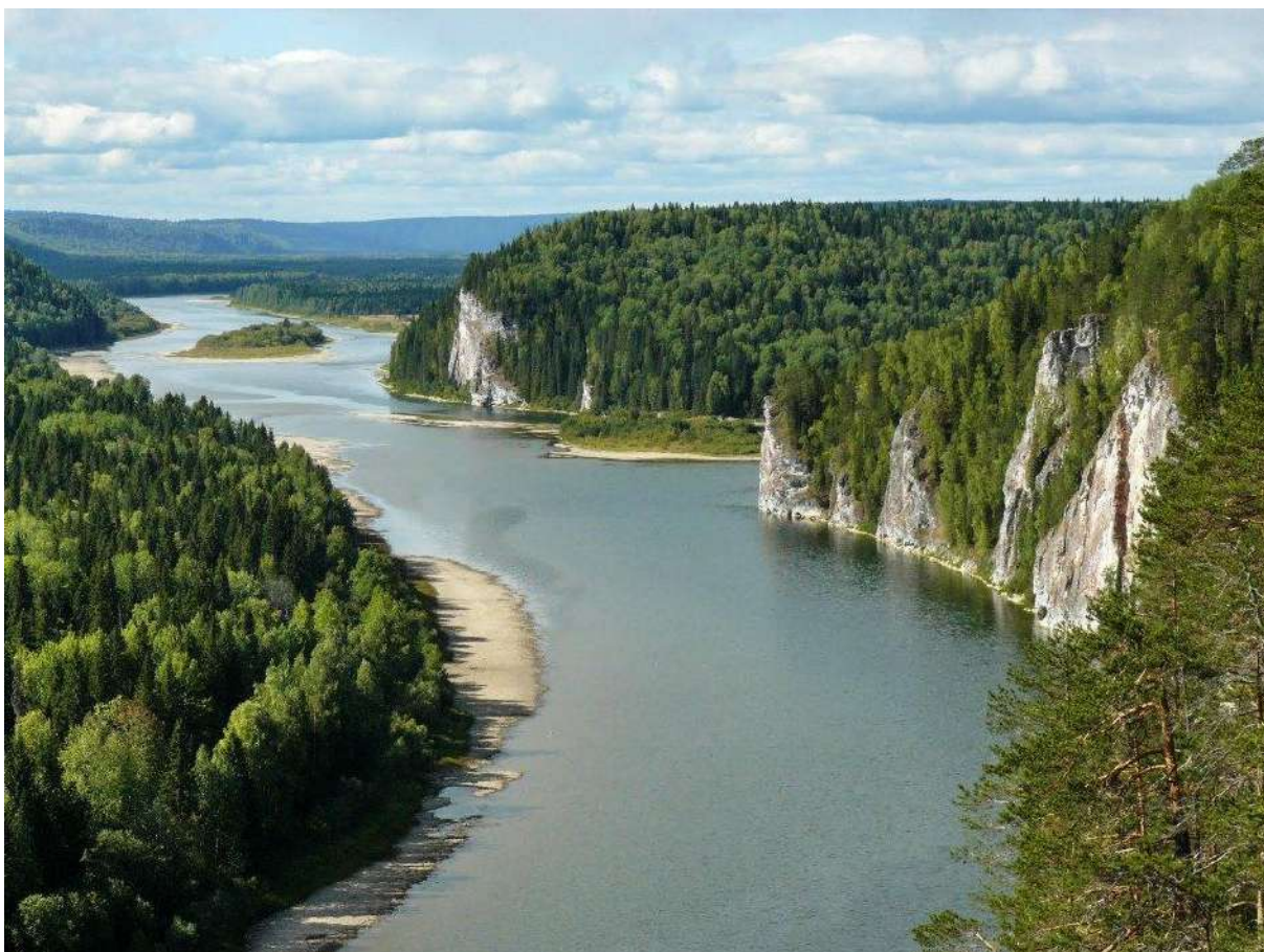
Вишера на Урале