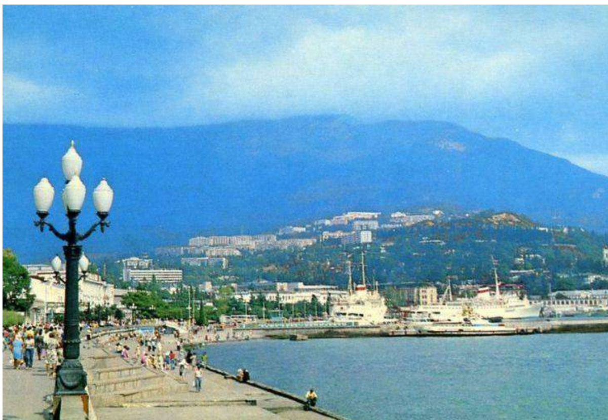
Ялта в Крыму