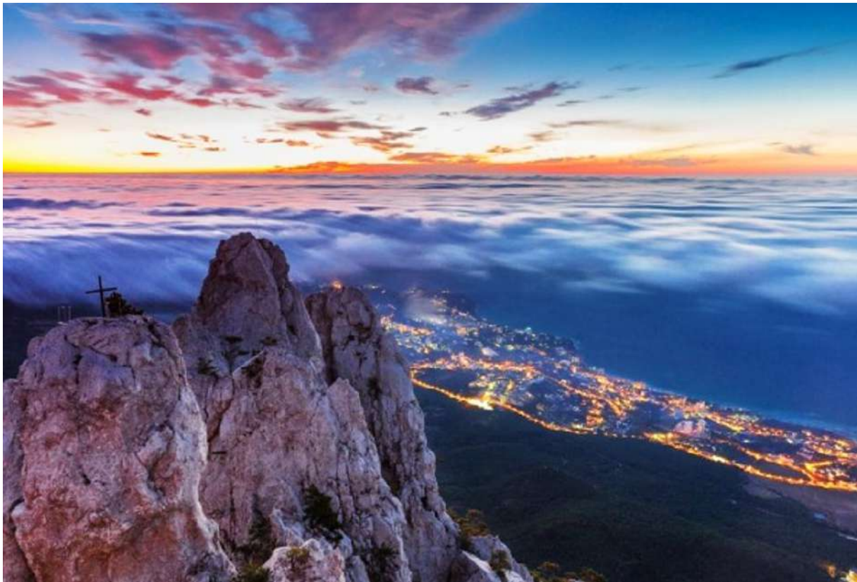
Ай-Петри, берег Крыма и облака на море