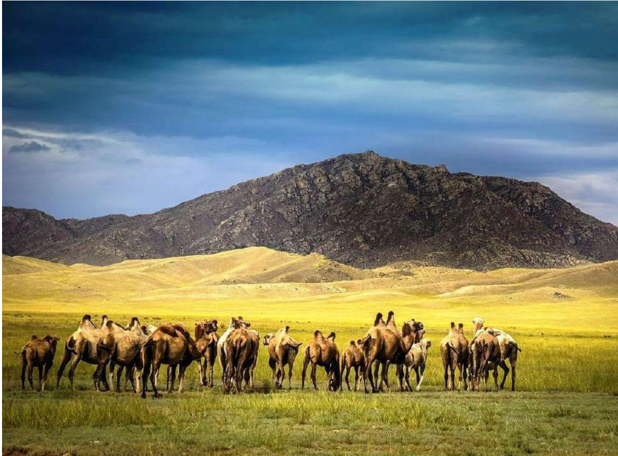
Верблюды в Туве