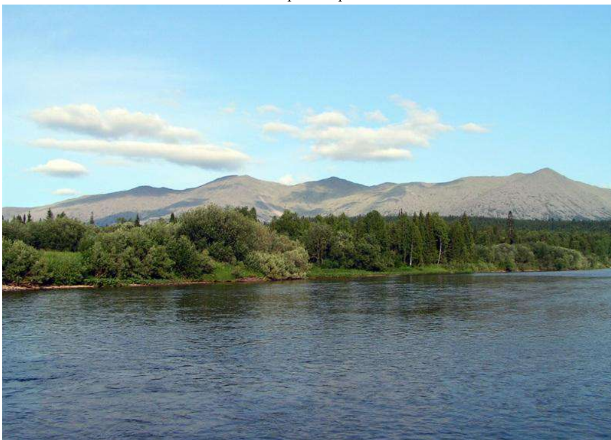
Тулымский Камень – вид из Вишеры