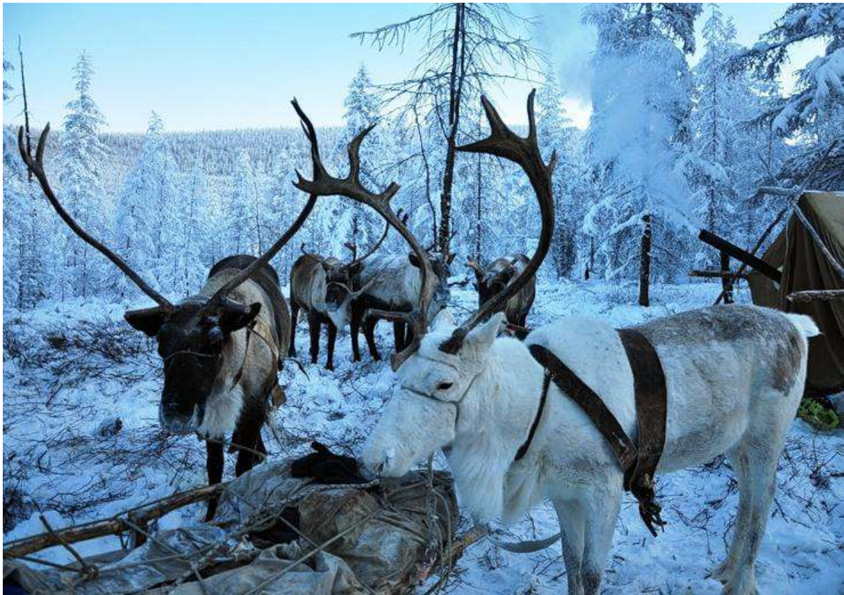
Северные олени в тайге