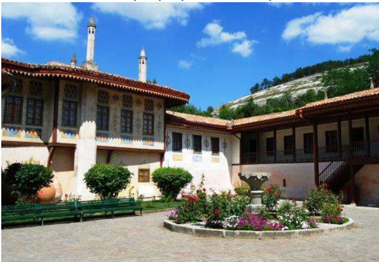
Ханский дворец в Бахчисарае в Крыму