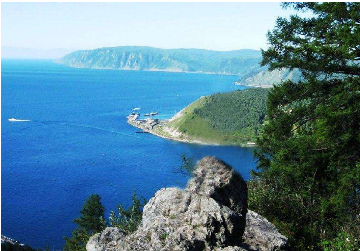
Байкал – вид из Камня Черского