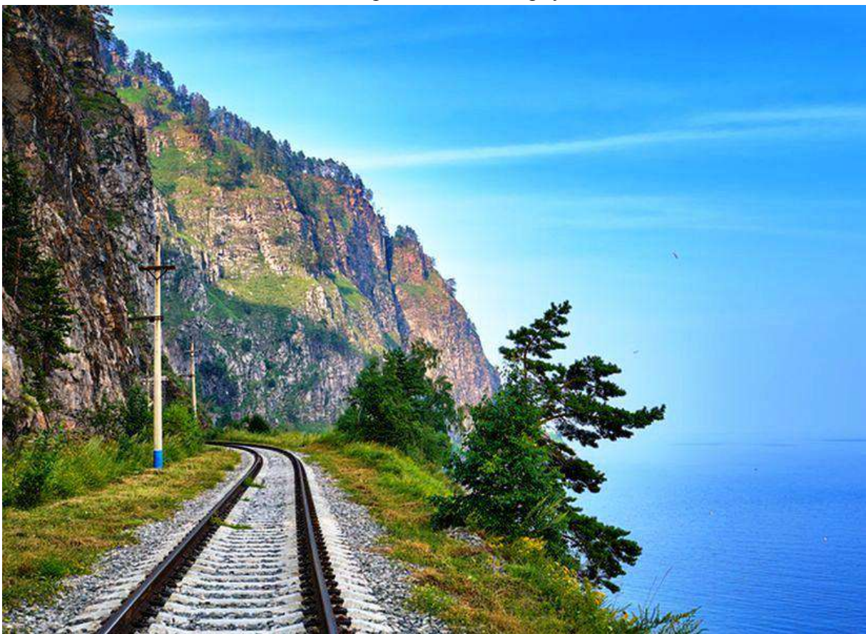
Железная дорога на берегу Байкала