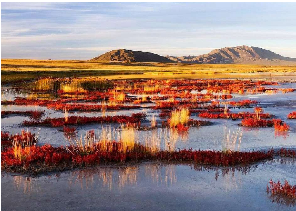
Озеро Дус-Хол в Туве